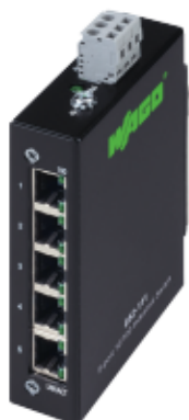
852-111 ECO Switch, 5 portos

Válasszon az ötféle csomagból és élvezze a velük járó kiegészítő terméket!