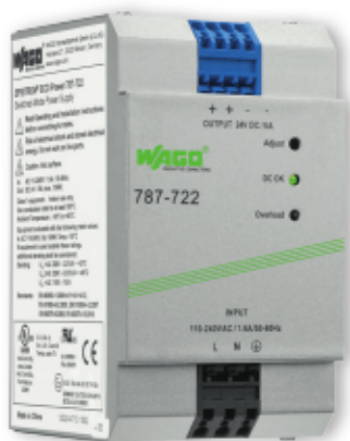
787-722 ECO Tápegység, 1-fázisú 24 VDC / 5 A