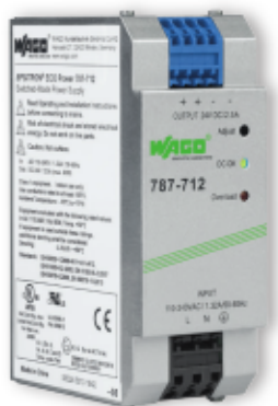
787-712 ECO Tápegység, 1-fázisú 24 VDC / 2.5 A