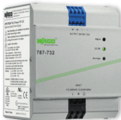
787-732 ECO Tápegység, 1-fázisú 24 VDC / 10 A